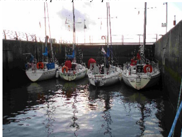
Poussez pas derrière, c'est pas ouvert !