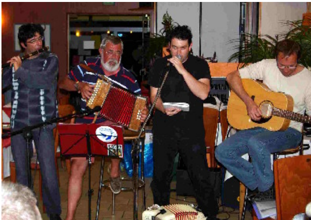
L'ambiance chauffe ! Place aux chanteurs !