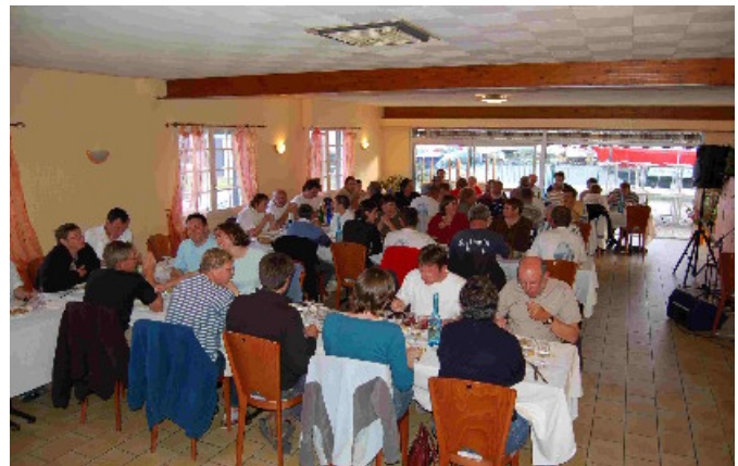
Bon appétit !