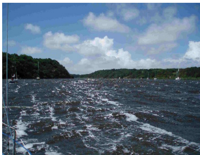
Le vent monte, ça commence à "fumer" !