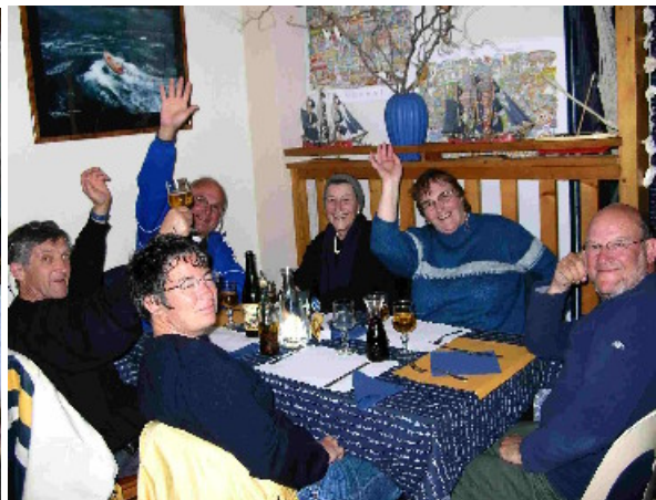
On reviendra !