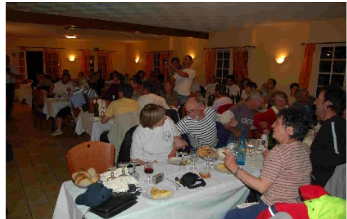
...et ça danse !

Ce n'est que sur les coups de 02 à 03h00 du matin que nous irons nous coucher après avoir consciencieusement parlé de l'association (statuts, projets, adhésions, que reste-t'il à boire ?,...).