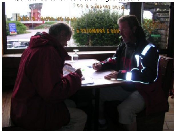
On relit les réponses, on compte les points et .....