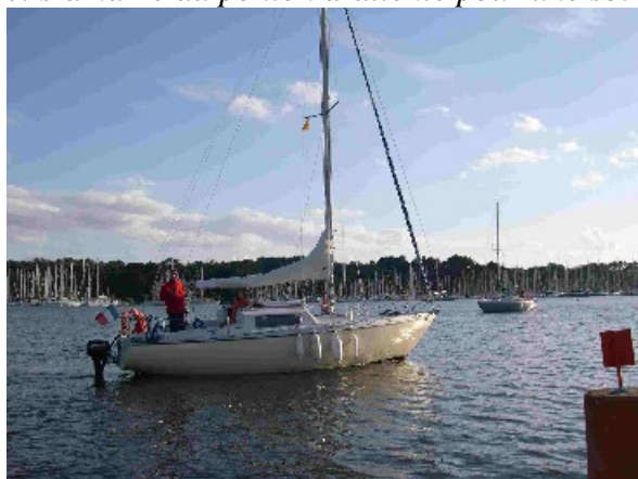
On y va ?

C'est à 20h00 que Twinsen, Folly brise, Kyrian, Capelem, Samsara et Lady M passe l'écluse et s'amarré au ponton d'attente pour une soirée musicale, plus que sympa !!