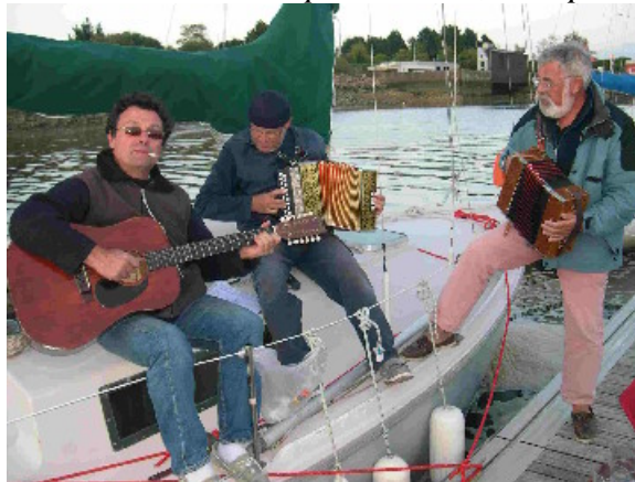
The Ponton Breizh Jazz Band