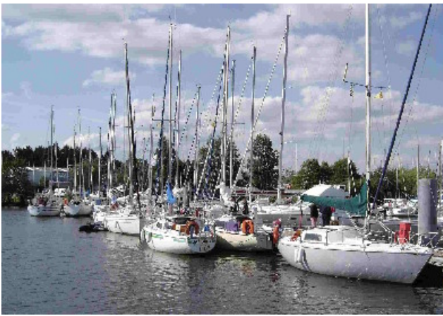
Tout le monde est là ?