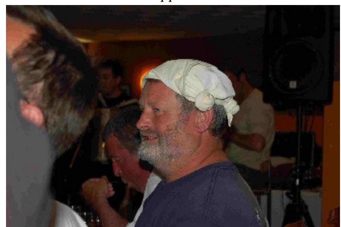
"Fait chaud !"