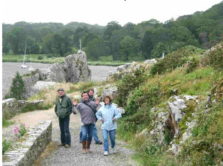
on est paumé !?