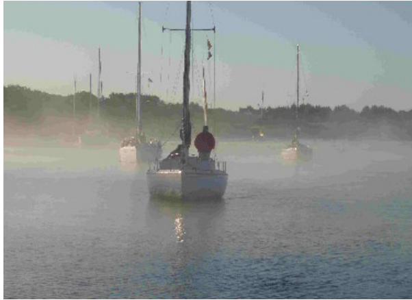
Après la mousse, la brume !