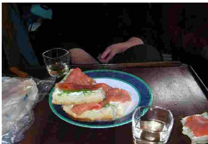
A table !!!!

Pour notre part, n'étant ni patient ni raisonnable, nous partons pour une remontée express de la Vilaine sous génois seul (amplement suffisant, les rafales dépassant déjà les 30 nœuds !), les 4 milles nautiques qui nous sépare de la Roche-Bernard sont avalés promptement et c'est finalement embossé sur une bouée du port que nous déjeunerons. Le repas se passe tranquillement en surveillant la montée du vent dont les rafales nous obligent à donner de la voix pour nous entendre mutuellement.