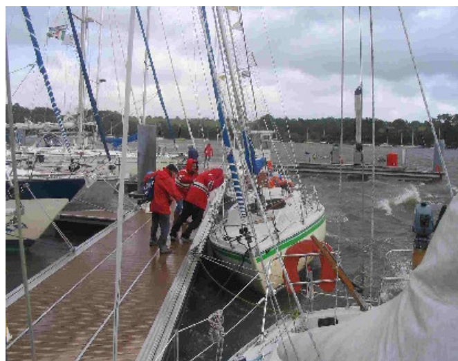
Amarres, pare battages, fort clapot et rafales.....

Pour notre part, n'étant ni patient ni raisonnable, nous partons pour une remontée express de la Vilaine sous génois seul (amplement suffisant, les rafales dépassant déjà les 30 nœuds !), les 4 milles nautiques qui nous sépare de la Roche-Bernard sont avalés promptement et c'est finalement embossé sur une bouée du port que nous déjeunerons. Le repas se passe tranquillement en surveillant la montée du vent dont les rafales nous obligent à donner de la voix pour nous entendre mutuellement.