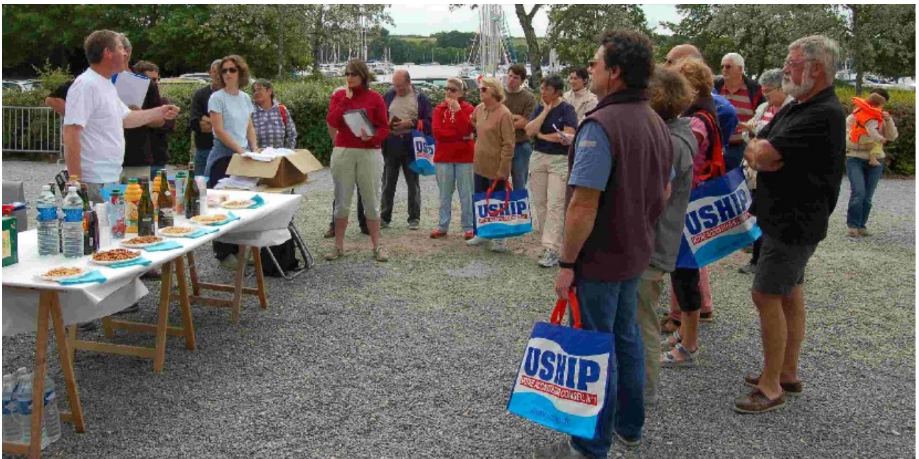
Briefing pour le WE, présentation de l'association et pot de l'amitié dans la matinée

Samedi 26 mai : Début du rassemblement annuel des Sangria et Aquila