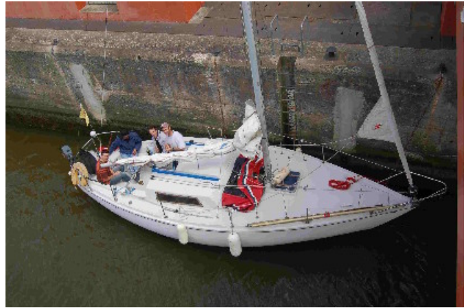
Non ! Les derniers sont encore dans l'écluse !