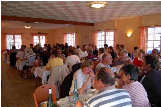
Tout le monde à table !