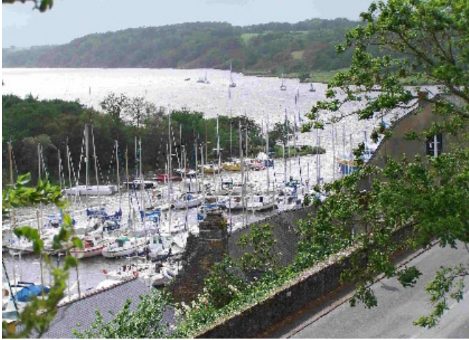
Le vieux port de la Roche-Bernard

Pendant ce temps là, quelques courageux partirent pour la Roche-Bernard où se déroulait un rallye pédestre Questions,, Résultat