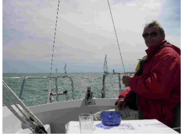
Tiens ! C'est "encore" l'apéro sur Twinsen

Merci à tous pour votre participation, à l'année prochaine !