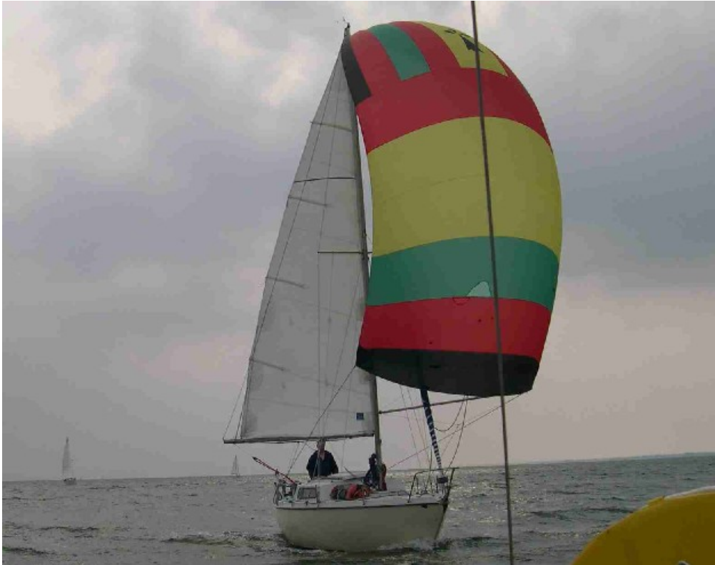
Lady M remonte la Vilaine sous spi

remontée de la Vilaine sous spi en début de soirée et le passage de l'écluse nous permet de poser les pieds sur les pontons du port d'Arzal où Yves et Martine, organisateurs du rassemblement, nous attendaient impatientement.