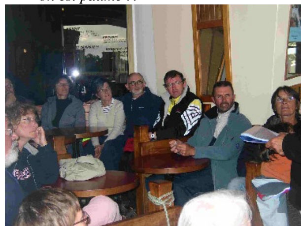
.....on proclame les résultats.