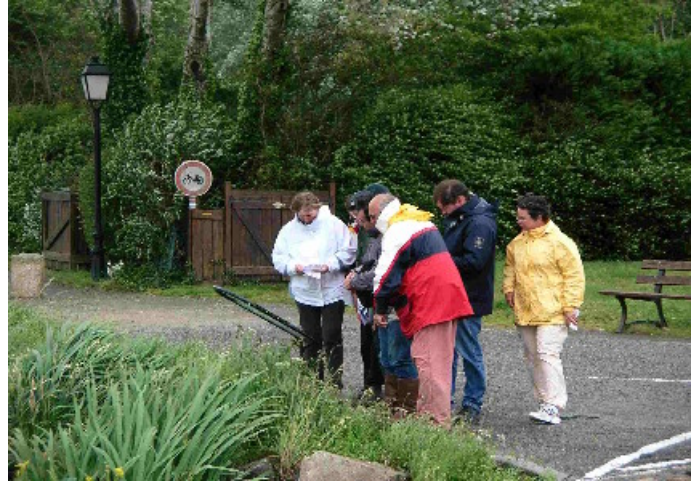
C'est par où ???