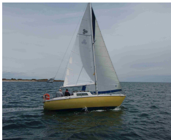
"Kerlevenn" et "War raog"

Deux options bien distinctes séparent les concurrents dès le départ, les uns partant Nord-Ouest, les autres plus vers le Sud. Il n'y aura finalement pas de gros écart entre les deux versions adoptées.