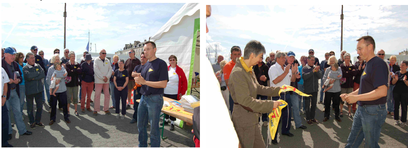
Le mot et le pot d'accueil du 8 ème rassemblement du Sangria et de l'Aquila