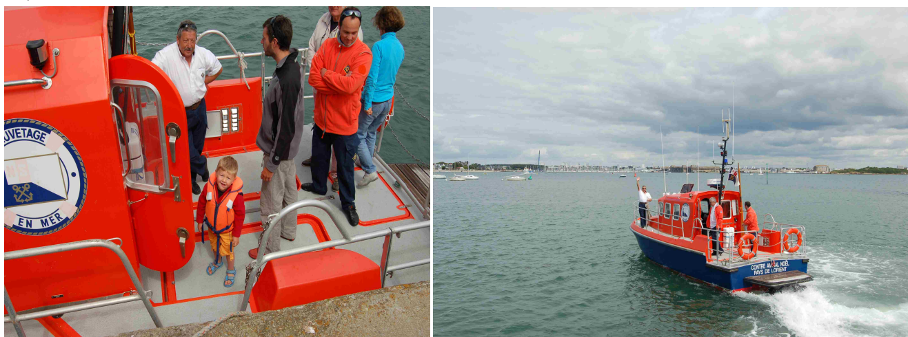
La vedette de sauvetage en mer "Contre Amiral Noël" du pays de Lorient

Vient ensuite le pot de l'amitié durant lequel tout un chacun peut s'il le désire, visiter la vedette S.N.S.M. que son équipage a amarré le long du môle à quelques pas du chapiteau.