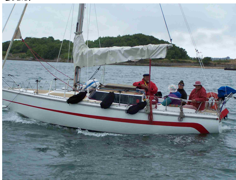
Croix du sud en route vers Hennebont

La remontée du Blavet, vers la mi-marée, ne présente pas de difficulté particulière; le chenal est bien balisé. Les deux bateaux arrivent un peu avant quatorze heures pour s'amarrer à l'ancien quai des sabliers. Casse-croûte tranquille puis appareillage au début du jusant vers quinze heures pour retrouver, vers dix sept heures trente, les sept autres bateaux encore à Port-Louis.