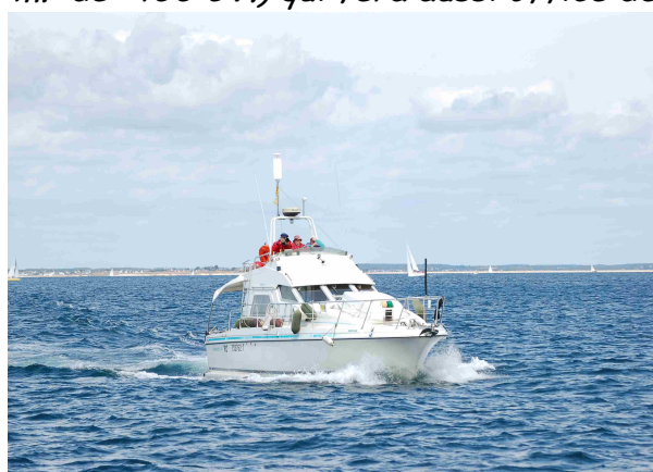
"Margin" le comité de course !

Vers 12 H 30, retour à bord pour le déjeuner en attendant 14 H 00, heure prévue pour libérer les coursiers sur le parcours balisé. Ce sont 17 bateaux, ( 9 Sangria, 6 Aquila et 2 sympathisants ) qui s'engagent dans la passe sud de Lorient pour rejoindre la ligne de départ qui sera donné entre la " Bastresse Sud " et la vedette de surveillance Margin (Antarès 11,20 m. de 400 CV.) qui fera aussi office de bateau comité.