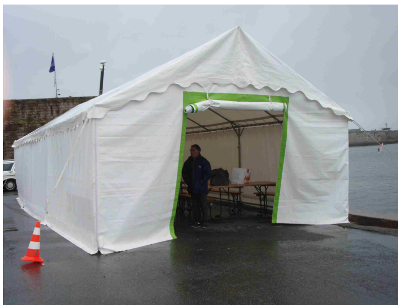
Le chapiteau prêté par la mairie

Il était demandé qu'il y ait quelques volontaires, vendredi matin, pour aider les employés de la ville à monter le chapiteau qui devait nous abriter (c'est le mot qui convient) durant cette manifestation : Les bénévoles ont répondu présents et l'affaire fut rondement menée, y compris le transport et la mise en place des tables et chaises.