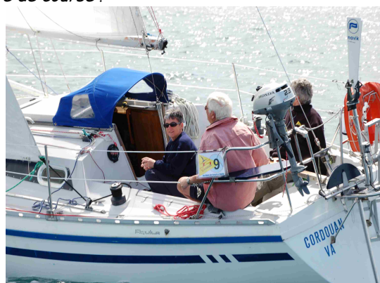
An Ty Ca Jo et Cordouan sur le départ

Il fait beau, (il ne pleut pas!) le vent est moyen et pas très régulier. Compte-tenu des conditions, c'est le parcours de 15 milles nautiques qui a été retenu, celui qui doit emmener les concurrents virer la bouée "Speerbrecker "devant Port Tudy et revenir de nouveau