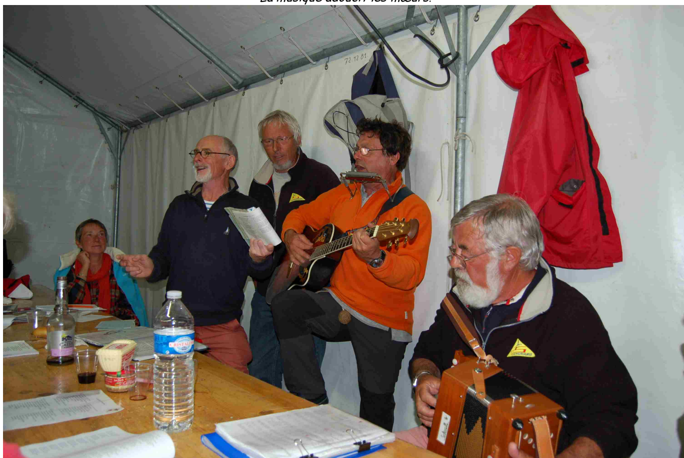
La soirée continue!