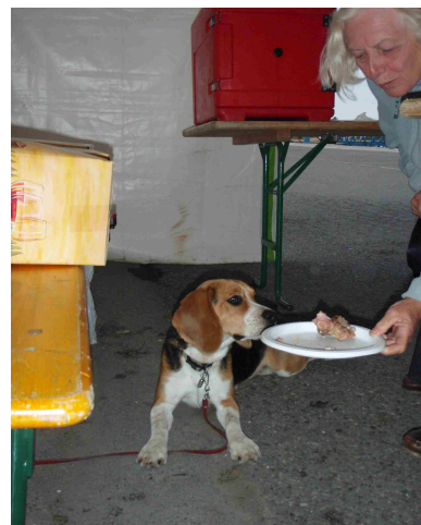
L'ambiance prend dès l'apéro ce qui n'est pas pour déplaire à "Fridu"