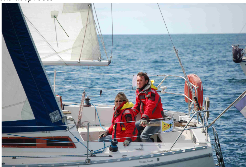
"Fleur de Sel II"

Deux options bien distinctes séparent les concurrents dès le départ, les uns partant Nord-Ouest, les autres plus vers le Sud. Il n'y aura finalement pas de gros écart entre les deux versions adoptées.