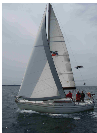
"Kyrian" et "Folly Brise"