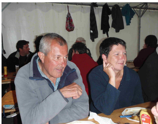
La musique adoucit les mœurs!