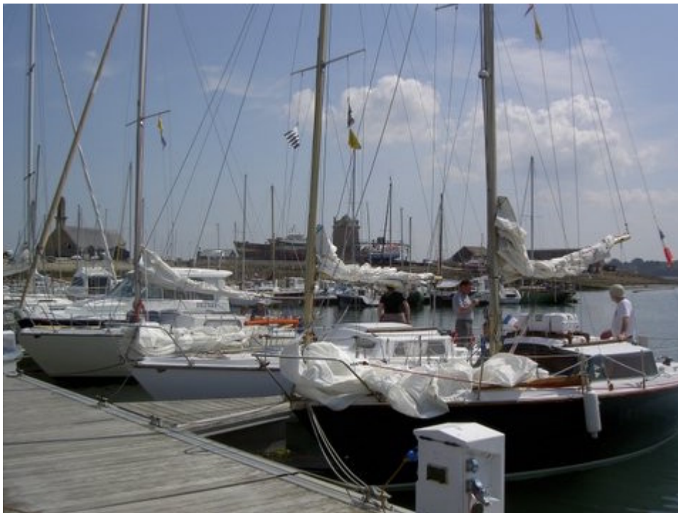
Trois Sangria à Camaret, on a déjà vu ça ici !

Mercredi 07 mai 2008 : Camaret-sur-mer → Loctudy (65 nautiques)