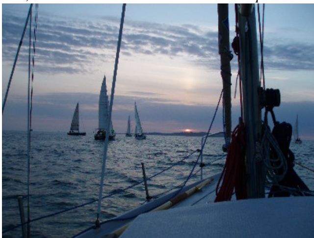
Signal d'avertissement : 07h00 !

07h00 du matin, c'est tôt, mais la lumière est superbe ! La pétote nous inquiète un peu dans la mesure où il est impératif d'avoir passer l'écluse de Perros-Guirec avant 19h30 sous peine de passer la nuit dehors au mouillage. Le départ est donné dans un souffle d'air donnant lieu à un ballet de voile au ralenti essayant de s'extirper le plus rapidement possible de la zone. Heureusement, la brise ne tarde pas à rentrer et à entraîner la flotte dans une grande cavalcade, vent de travers dans la Manche sous spi.