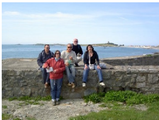
Un peu de repos en attendant le bus...