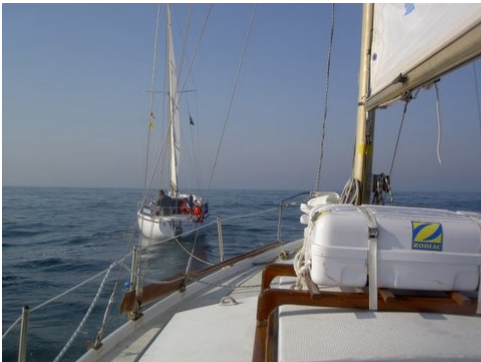
Elsewhere en remorque de Mariavah au large de Portsall.