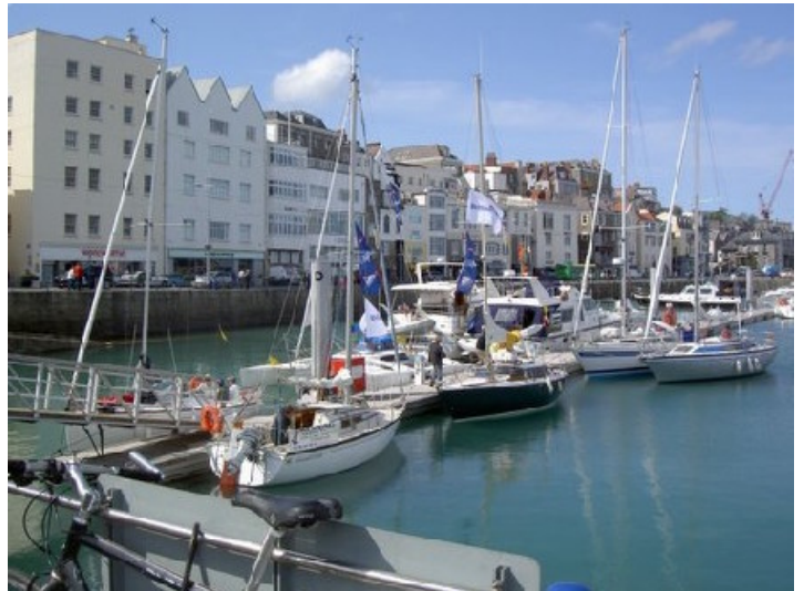
...Elsewhere sont arrivés.