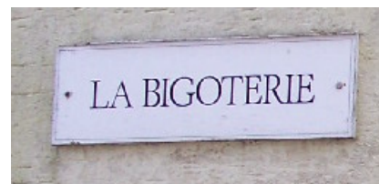
"Français" caractéristique des Anglo-normandes