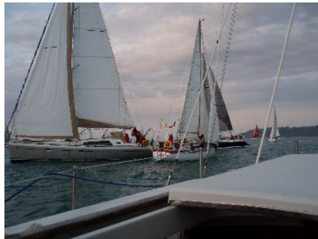
Au coude à coude avec les "Gros" !