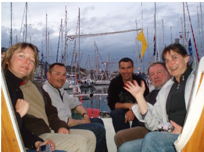
La bonne humeur est de mise entre les équipages de plans Harlé (Armagnac) !