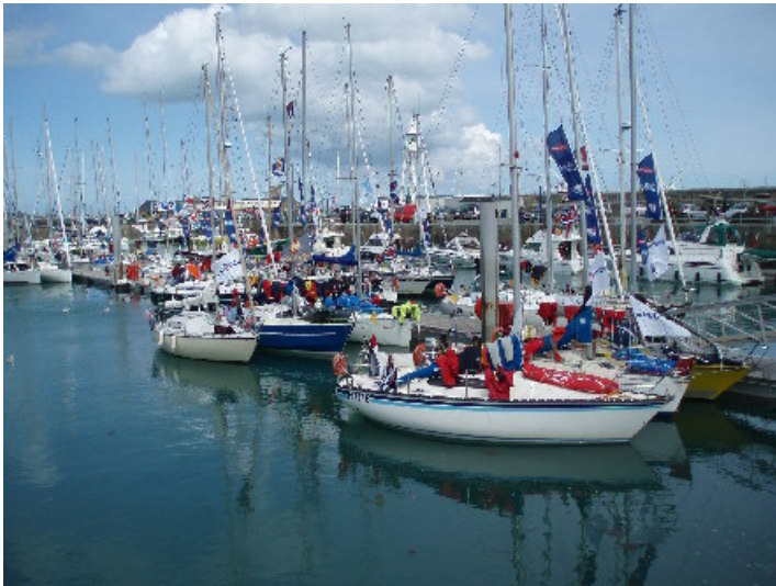
Lady M et ...