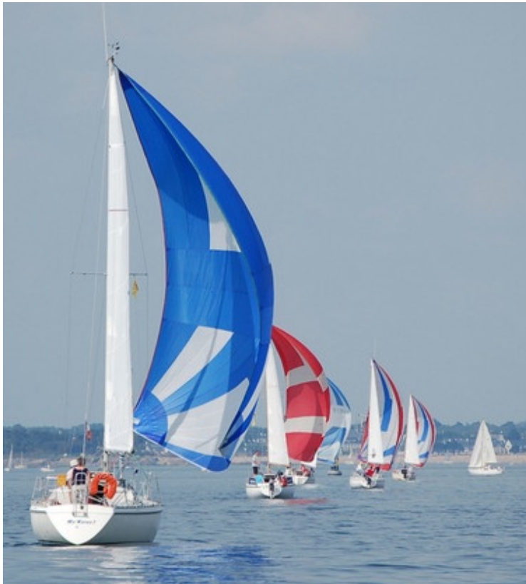
La flottille vue de l'arrière...