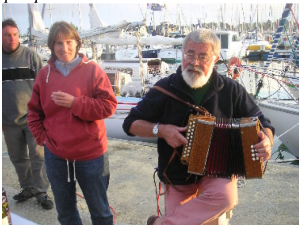
Premières notes, premiers chants,....