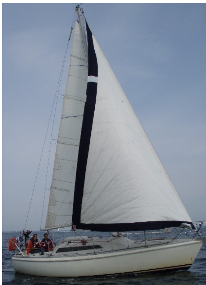
LIBERTAD en route vers l'île aux Moutons