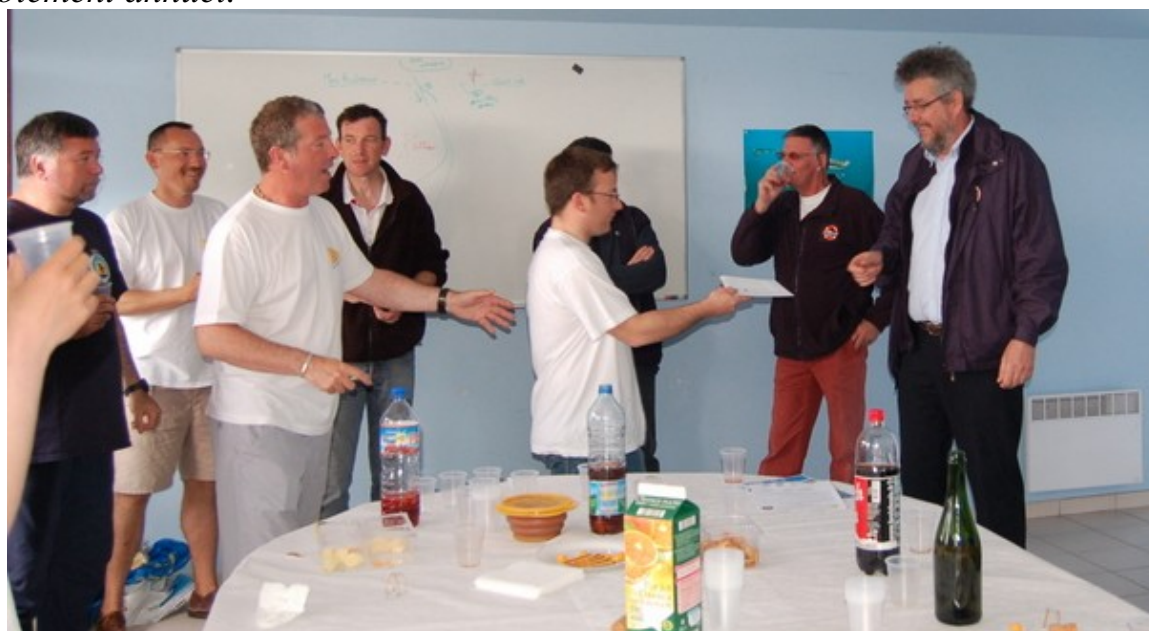
Remise traditionnelle d'un chèque à la SNSM et adhésion à la SNSM de Loctudy.