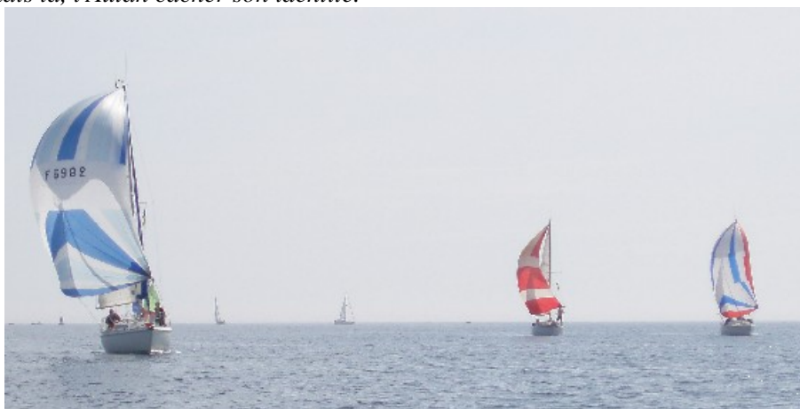
L'AUTAN, MARIAVAH et TWINSEN au coude à coude !

note : les plus observateurs auront sans aucun doute remarqué qu'il y avait trois skippers de la Royale engagés dans la course et que ces derniers ont pris les trois premières places ! Un autre, plus fourbe encore, fait également remarquer que les deux premiers sont Brestoïis ! mais là, l'Autan cache son identité.