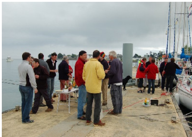
Fumage de poisson, premières discussions animées...