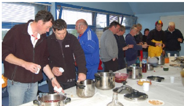
Election aussitôt suivie d'une dégustation !