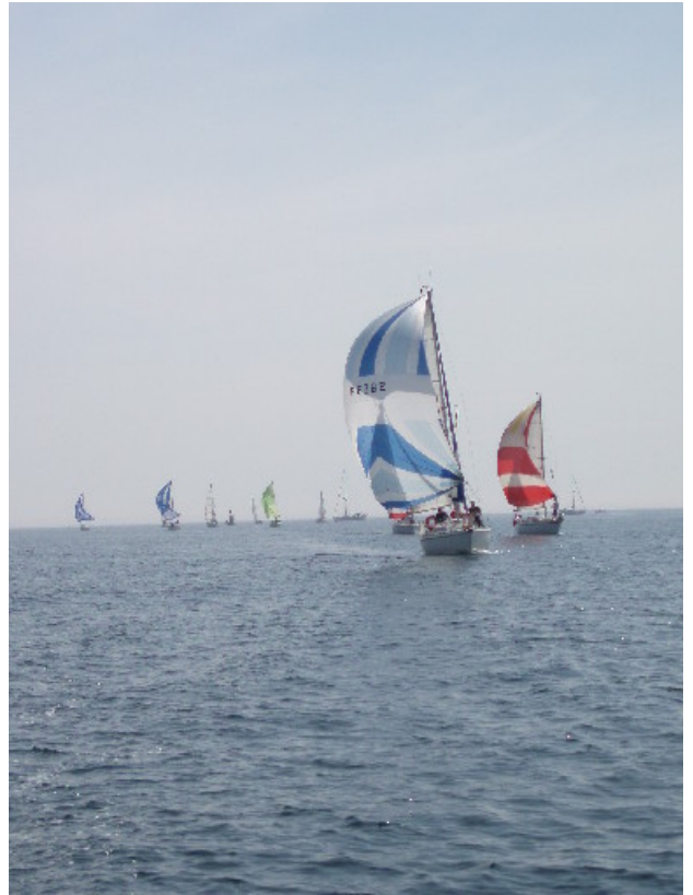
...vue de l'avant.