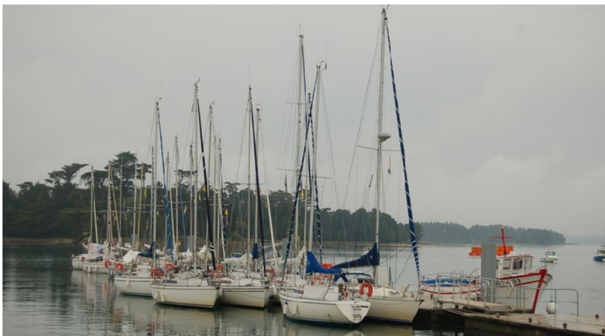
12 Sangria, 7 Aquila, 3 accompagnateurs : Que du beau monde !