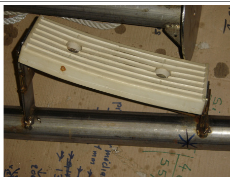
Accessoires de remorque à bateaux