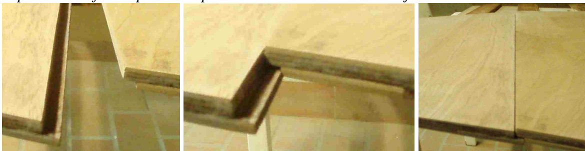
Jonction entre deux panneaux

Pour faciliter le rangement, j'ai fait en sorte que les trois morceaux puissent s'empiler sans surépaisseur. Il fallait pour cela prévoir des décrochements aux jonctions