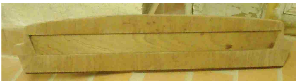
Le panneau supérieur