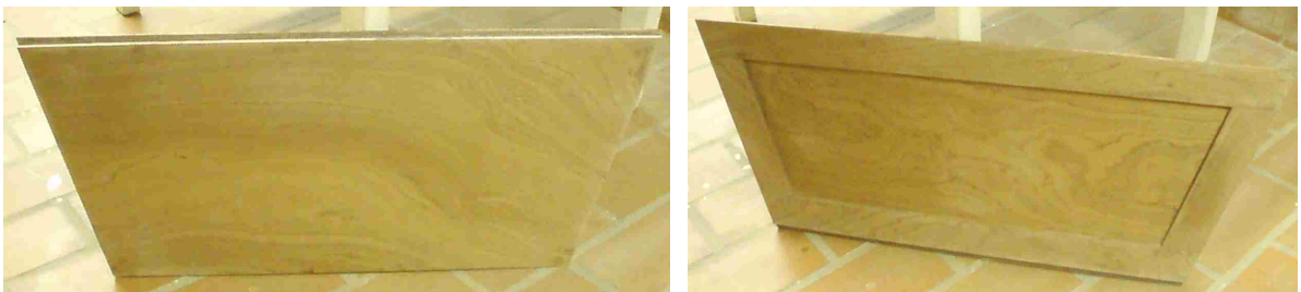
Panneau du milieu

Pour économiser sur le bois et alléger l'ensemble, le nouveau panneau est constitué d'une planche de CP acajou de 9mm d'épaisseur complétée sur les bords par des morceaux permettant le calage une fois à poste.