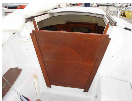
Présentation de l'ensemble