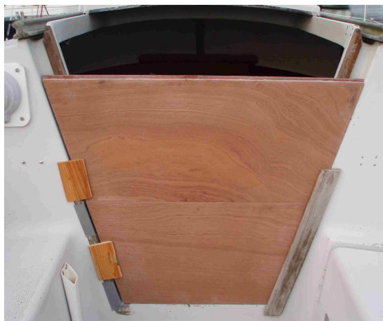
Présentation des panneaux avant montage définitif des glissières