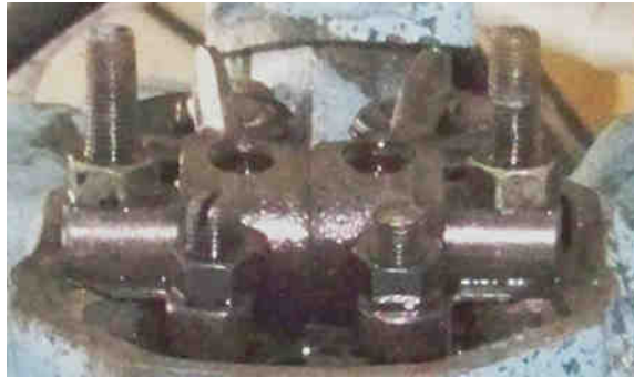
Rampe de culbuteurs en place