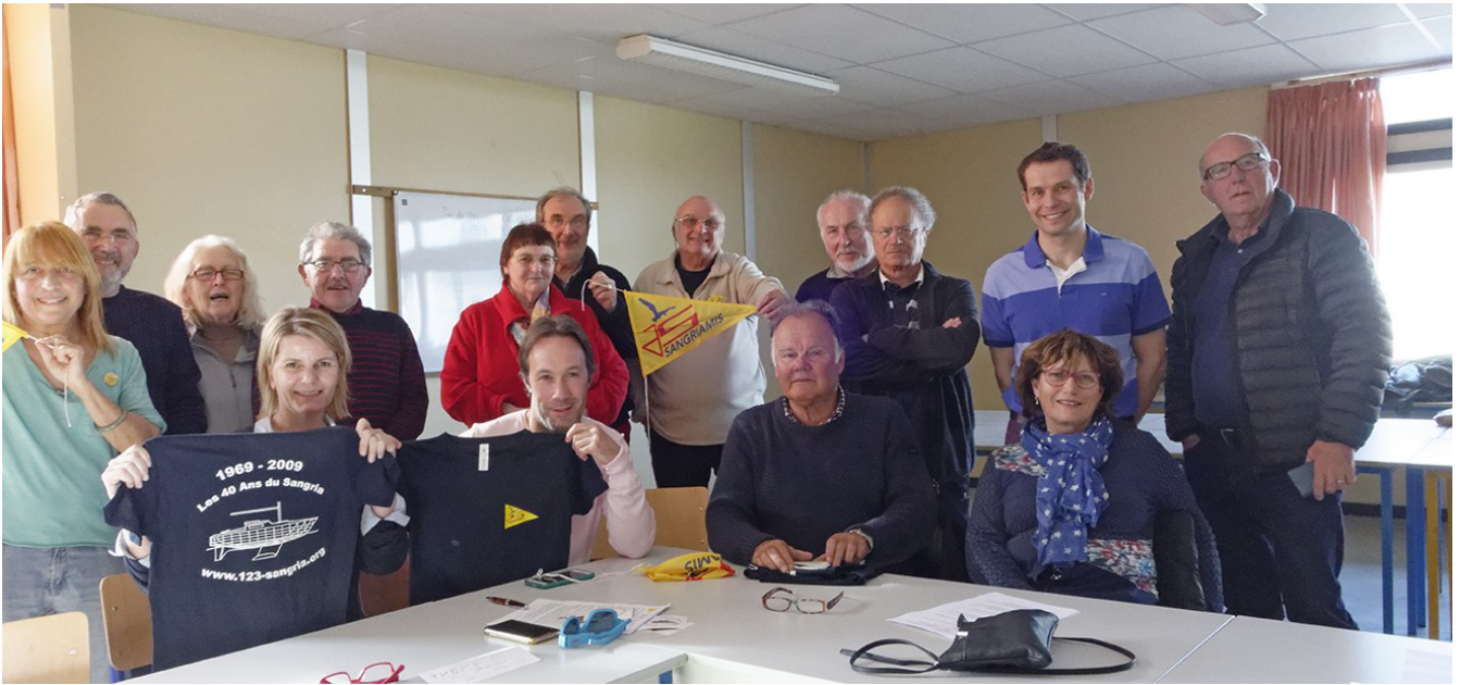
Diner entre Sangriaquilamis à la crêperie favorite du président