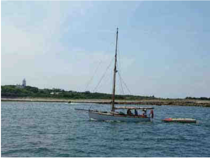
Pour continuer une petite virée sur St Agnès un vrai petit bijou avec son phare blanc....