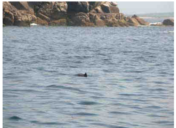
Nous voila accompagnés par les dauphins...