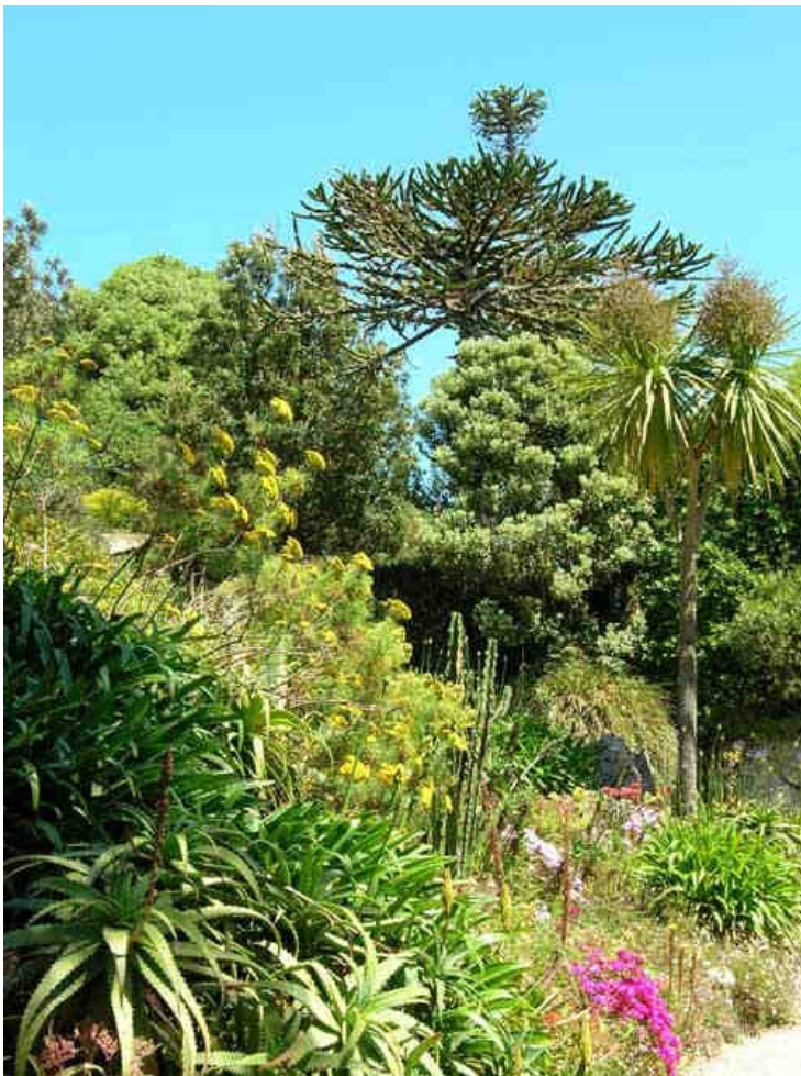
La végétation nous dépayse, nous ne sommes pas en Angleterre ! ce n'est pas possible...