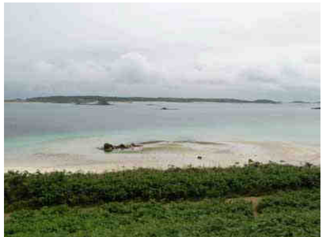
Des paysages magnifiques...