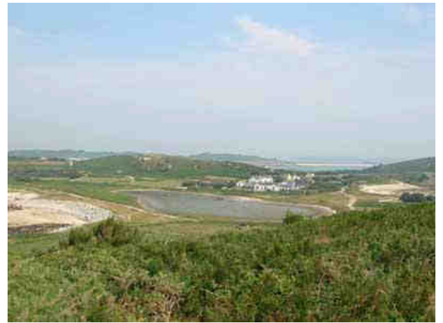
Puis la visite de l'île de Bryher...