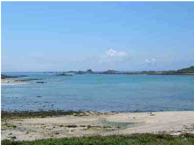
Allez une dernière...