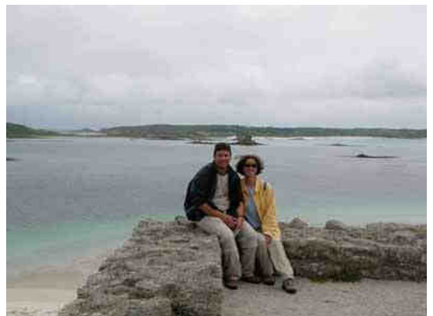
L'équipage au complet...