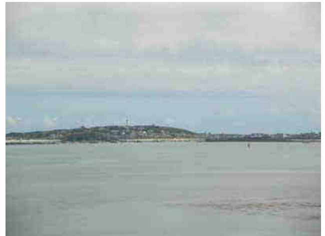
Le samedi 1er juillet : départ pour bishop rock...vue sur St Mary