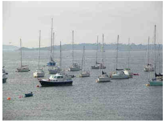
Fleur de sel mouille au milieu des grands... cherchez-le !

Nous partons à la découverte des joyaux de l'île