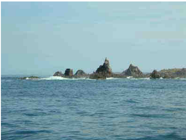
Des roches encore des roches...