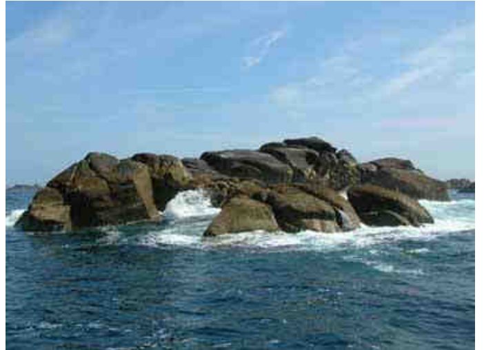
Que de beaux cailloux...