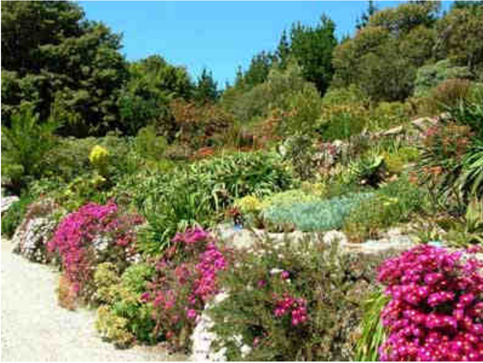
Cette visite a été un vrai bonheur....