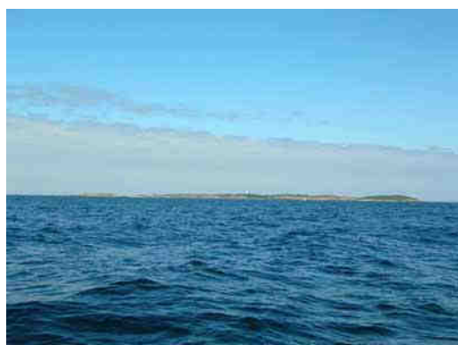
Jeudi 29 juin : Après avoir croisé deux derniers cargos dans les rails Anglais nous voilà enfin devant les Iles Scilly, Saint Agnès avec son phare blanc nous montre le chemin....