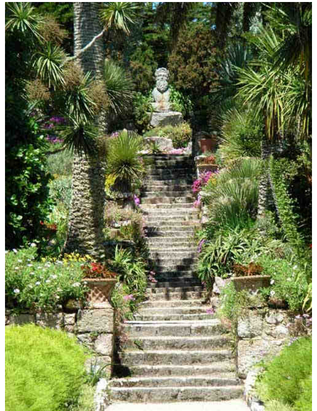
Neptune veille sur ce parc avec sagesse !...