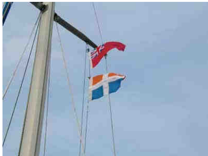
Nous arborons les pavillons de l'Angleterre et des Iles Scilly...