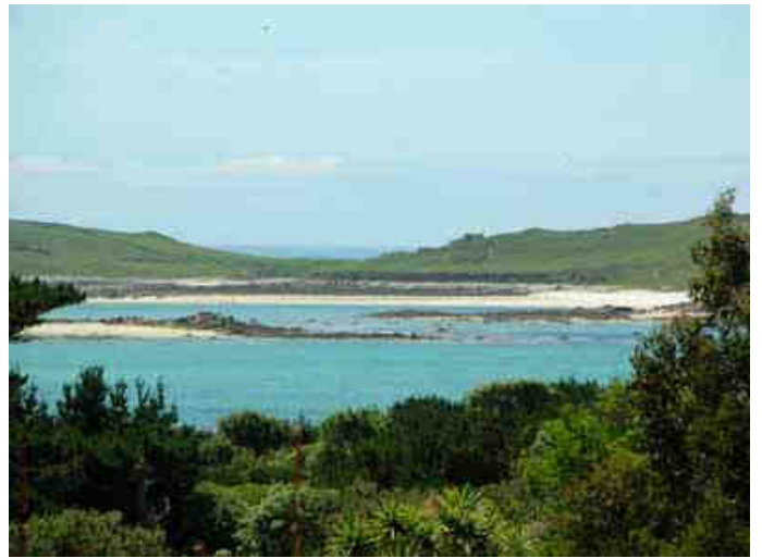
et ça c'est ty pas beau !... nous on a craqué