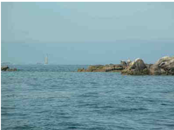
Bishop rock se dévoile au loin...