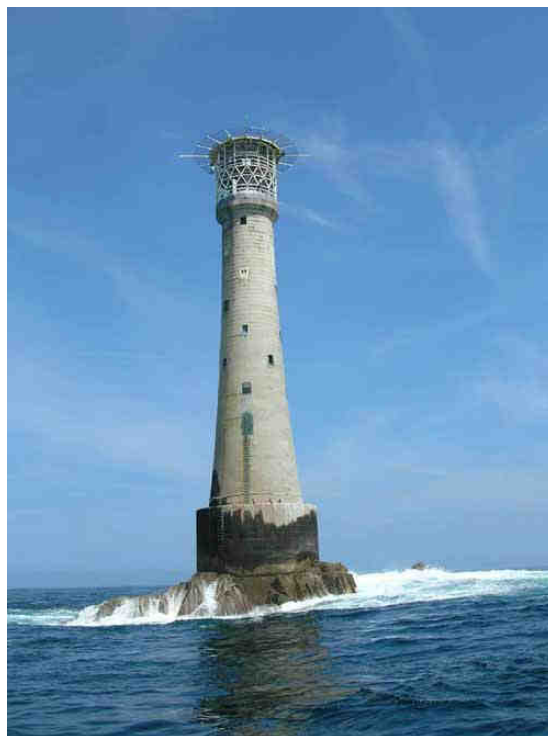
Le bout de l'Angleterre, le phare de Bishop Rock terre la plus à l'ouest de sa majesté, majestueux....