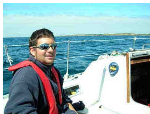
Le capitaine mal rasé...savoure la première partie de ce périple...arrivée vers 12h49 au port...nous croisons des Anglais qui nous saluent chaleureusement...