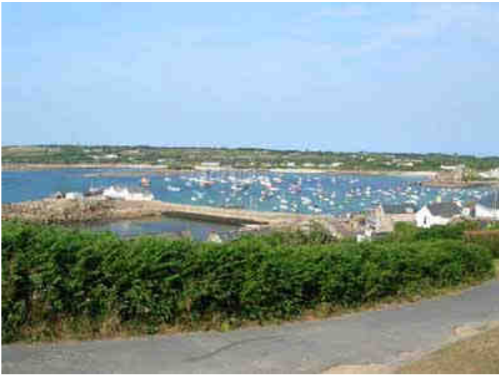
Le port de Saint Mary's

Nous partons à la découverte des joyaux de l'île