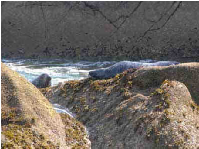
Les phoques aussi sont de la partie...