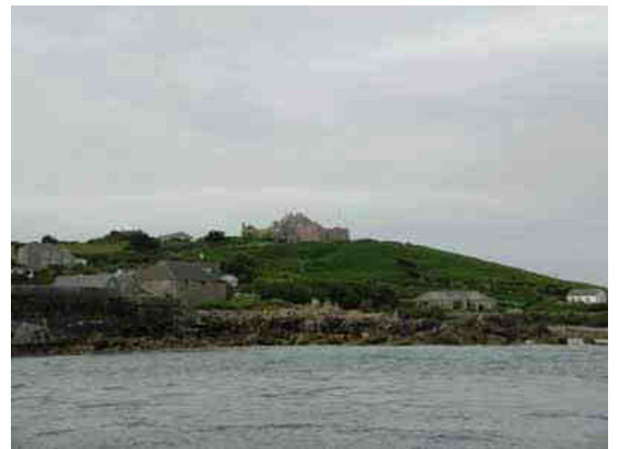
Le fort de saint Mary veille sur les bateaux