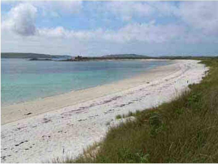
N'est elle pas belle cette plage ?