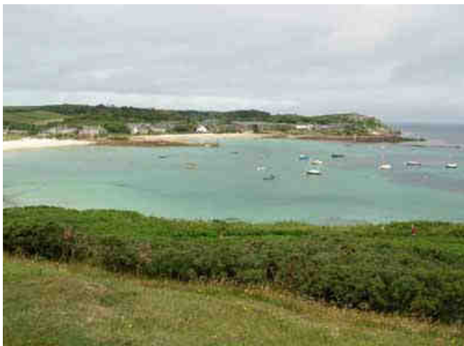
Toujours des ports...