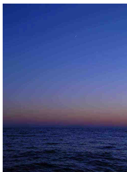
Après une nuit calme durant laquelle on a croisé peu de bateau ou cargo... nous voici devant un magnifique lever de soleil sur fond de lune...