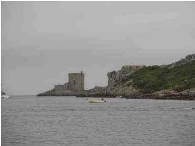
vendredi 30 juin : nous partons visiter la 2ieme plus grande ile des Scilly, Tresco et son jardin botanique..