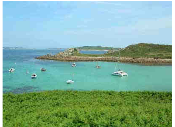
L'anse où l'on débarque est magnifique...que du bonheur...