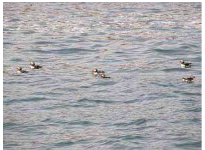
Un troupeau de macareux