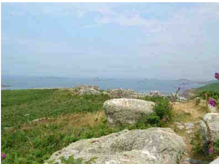
Dimanche 2 juillet : petite ballade sur l'île de Samson