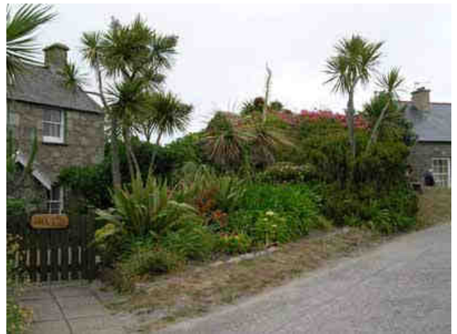
Charmant cottage à l'Anglaise...