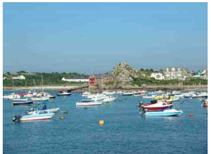
Charmant petit port n'est ce pas !...